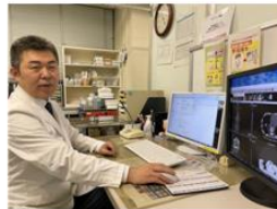
臨床腫瘍科・岩谷岳教授外来を受診 過去に受けた手術などの切除臓器 から遺伝子変異を特定