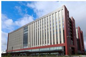
岩手医科大学附属病院がんセンター がんゲノム室（病院総務課内） 019-613-7111 内線6039